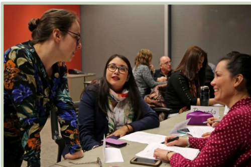
Atelier de conversation française

11 novembre 2019 : accueil des usagers du CHSLD Armand-Lavergne.