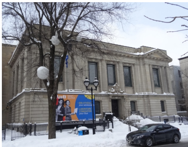
BANQ - ST-SULPICE

Les Amis sont fiers de soutenir la Fondation en versant 1 000 $ en commandite pour l'événement.