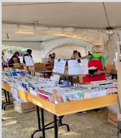
Sous chapiteau – août 2021

Ces deux marchés n'auraient pu être organisés sans la coopération et l'engagement de l'équipe de BAnQ, qui a mis à notre disposition de vastes chapiteaux en août, puis la superbe grande salle d'exposition de la Grande Bibliothèque en décembre.