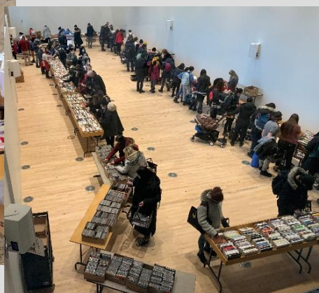
À la Grande Bibliothèque – décembre 2021

Au cours de ces marchés, nous avons pu écouler environ 45 000 documents (dont 15 000 provenant de tris réalisés avant la pandémie) grâce au travail patient et dévoué de 34 bénévoles qui n'ont pas hésité à travailler debout, pendant des heures, avec un masque sur le visage. Le premier marché a permis de renflouer les caisses dégingnées de notre association et le second de renouer avec notre engagement envers la Fondation de BAnQ.