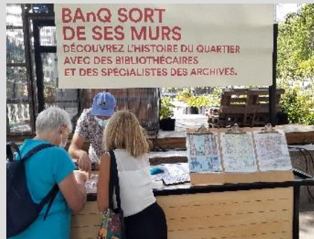
Aux Jardins Gamelin – été 2021

BAnQ a renouvelé sa présence aux Jardins Gamelin durant l'été 2021 en tenant un kiosque et une exposition en collaboration avec le Quartier des spectacles de Montréal. Les mardis, entre le 27 juillet et le 21 septembre, sept bénévoles, généralement en duo, ont accompagné les bibliothécaires et les archivistes de BAnQ. Leur rôle : soutenir le personnel de BAnQ dans l'accueil des visiteurs, la présentation des éléments et des documents à découvrir, et les échanges relatifs à l'histoire du quartier entourant la Place Émilie-Gamelin.